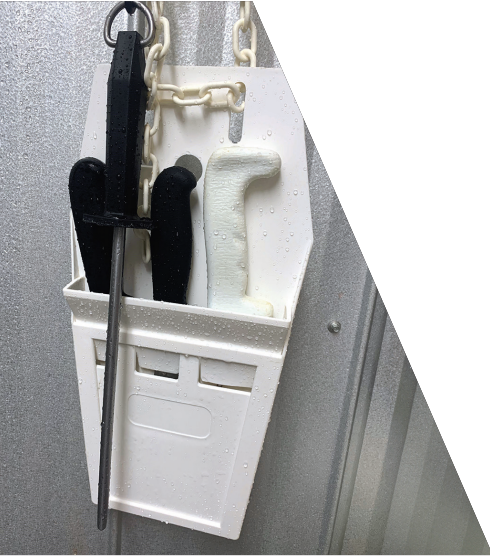
چھری کا کور